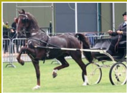
Unieko 'De meest allietische Manno-zoon'