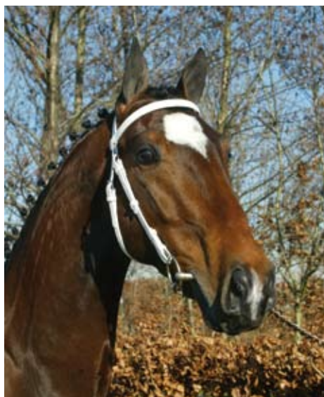
Het fraaie hoofd van Zeppelin