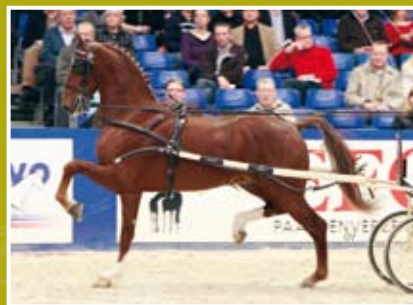
Aquarel 'Een heldere keuze!'