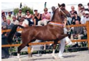
Anca (Unicko x Waterman); Kampioen Centrale Keuring Meerkerk 2008, Nederlands kampioen stermerries Nationale Tuigpaardendag 2008 Fokker/Eigenaar: W. Ruinemens, Rheden