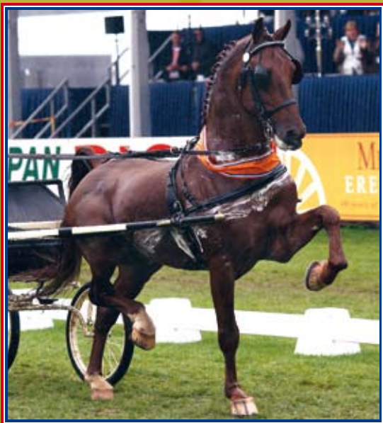
Stuurboord 'Kampioen in tuig & net even anders!'

Zilfia's Hoeve, Houten • Aanvang: 13.00 uur