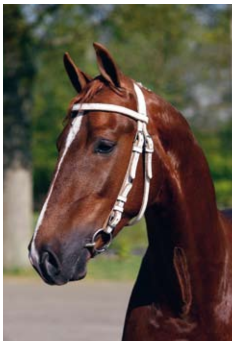
Het edele hoofd van Aquarel

Tijdens de afgelopen Hengstenkeuring in Den Bosch presenteerde Aquarel zich weer voor het eerst in het tuig. Hij liet zien een enorme ontwikkeling te hebben doorgemaakt en zijn optreden werd bijzonder gewaardeerd.