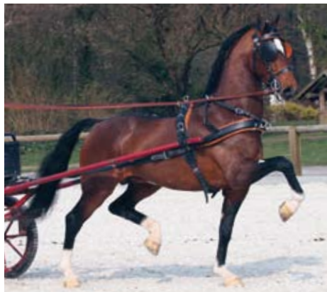
Een imponerende Zeppelin tijdens het verrichtingsonderzoek in Ermelo