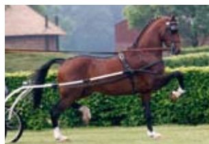
Zeppelin (Plain's Liberator x Fabricius), eerste goedgekeurde zoon van Plain's Liberator Fokker: R. Tewis, Westdorp