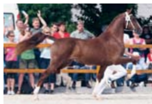
Aurose (Unicko x Fabricius); Ibpop-topper 2008 (89 punten) Fokker/Eigenaar: Th. Postma, Kollumerpomp