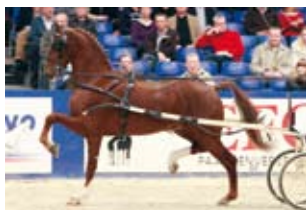
Aquarel (Unicko x Koblenz), eerste goedgekeurde zoon van Unicko Fokker: H.H.J. Tonnaer, IJsselstein

Paarden uit onze concoursstal, inclusief de goedgekeurde hengsten, wisten in 2008 aansprekende resultaten te boeken. Maar ook voor de nafok van onze hengsten was 2008 een fantastisch jaar!