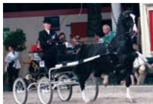
Wervelwind (Plain's Liberator x Droomwals); Kampioen ereklasse 2008, Categorie 4 Noord Fokker/Eigenaar: W. Clevering, Wijnjewoude Mede-eigenaar: H.J. Veenstra, Boyl