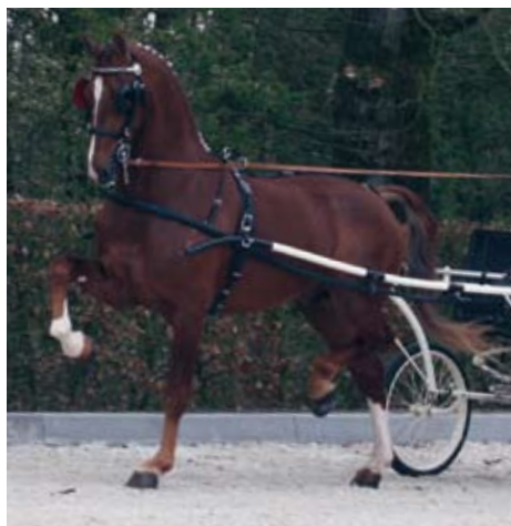
Aquarel tijdens het verrichtingsonderzoek in Ermelo