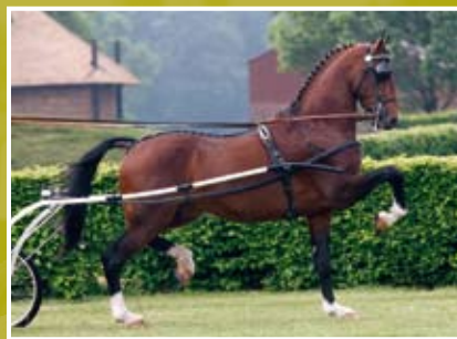
Zepplin 'Stijgt tot grote hoogte!'

'Uw zwarte partner in de strijd tegen inteelt!'