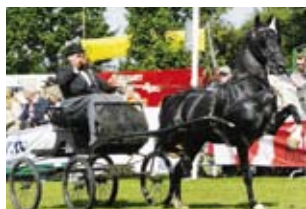
Plain's Liberator keur, eerste keurhengst Nederlands Hackney Stamboek Fokker: T.C. Middelma, Zevenhuizen